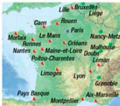
Les différentes antennes et correspondants ABM

Réunions tour du monde ou sur une destination Soirées projections-repas Ateliers photos Brunch et apéros voyage Cours de chinois Randos et week-ends Festivals... sont organisés à Paris et dans les représentations en région.