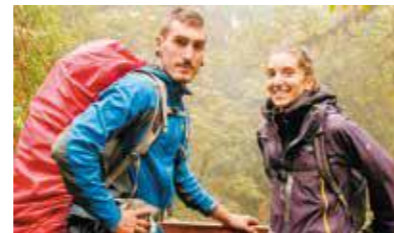
© Barbara Réthoré et Julien Chapuis