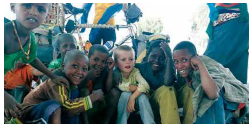
© Cécile Chapuis et Grégory Bunel

Film d'Henry Bizot, 35' Expédition réalisée par Henry Bizot dans la cordillère Quimsa Cruz, chaîne de montagnes peu visitée des Andes boliviennes. Au sein d'une vallée très peu explorée, avec Gabriel, grimpeur argentin, ils ont réalisé les ascensions de deux montagnes (5 600 m) rarement gravies, par des itinéraires nouveaux. Une extraordinaire aventure franco-argentine, au sein d'une vallée aux paysages absolument magnifiques. Henry Bizot, qui a réalisé de nombreuses expéditions dans divers massifs montagneux du monde (Andes, Himalaya, Pamir, Xinjiang), a mené cette expédition suite à une intervention sur un cancer du poumon. À cette expédition, il a associé une action d'entraide au profit intégral de la recherche contre le cancer du poumon.