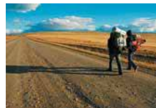
© Jamel Balhi, Geoffroy et Loïc de la Tullaye, Alexandre Lachavanne